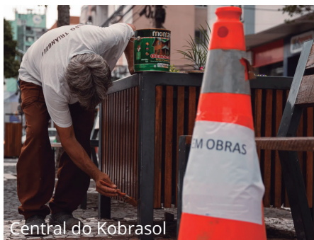
Central do Kobrasol