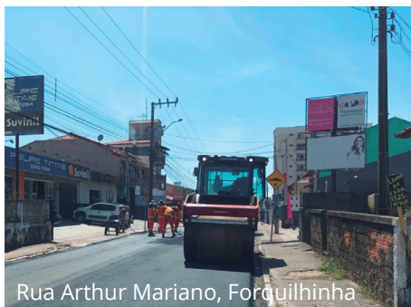
Rua Arthur Mariano, Forquilha