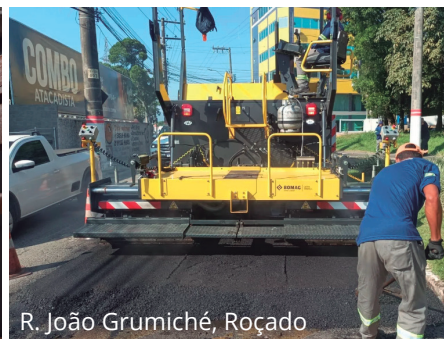
R. João Grumiché, Roçado