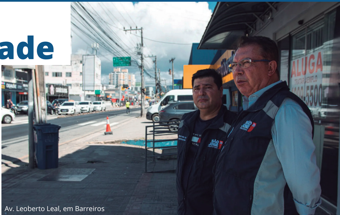
Av. Leoberto Leal, em Barreiros

Ao todo, são 46 vias que estão recebendo pavimentação asfáltica, totalizando 29 km (em andamento ou finalizado no período de 2023 até março de 2024).